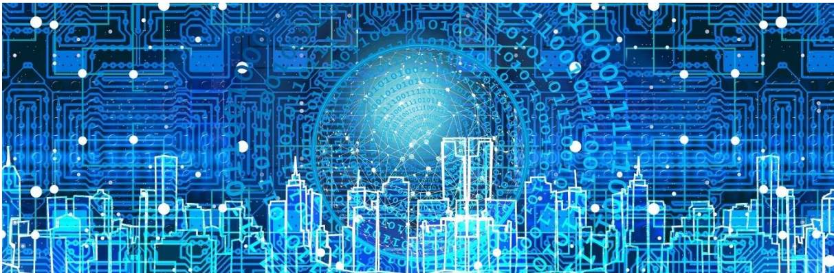
Bestandsmodellierung von Gebäuden und Infrastrukturbauwerken Mittels KI zur Generierung von Digital Twins